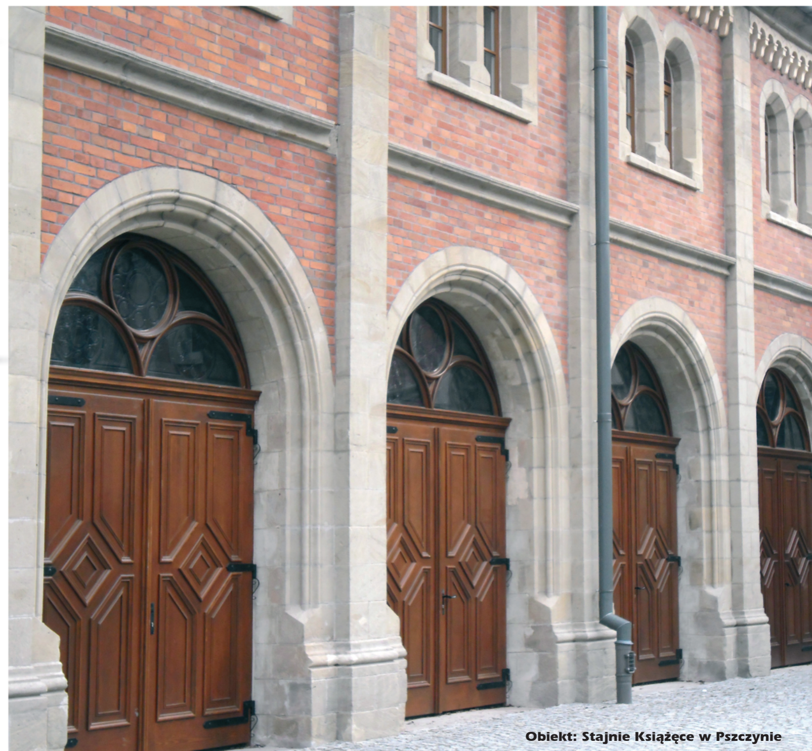
Obiekt: Stajnie Książęce w Pszczynie